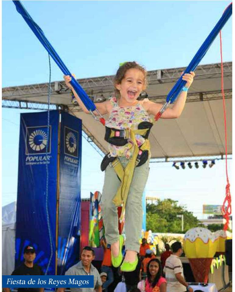
Fiesta de los Reyes Magos