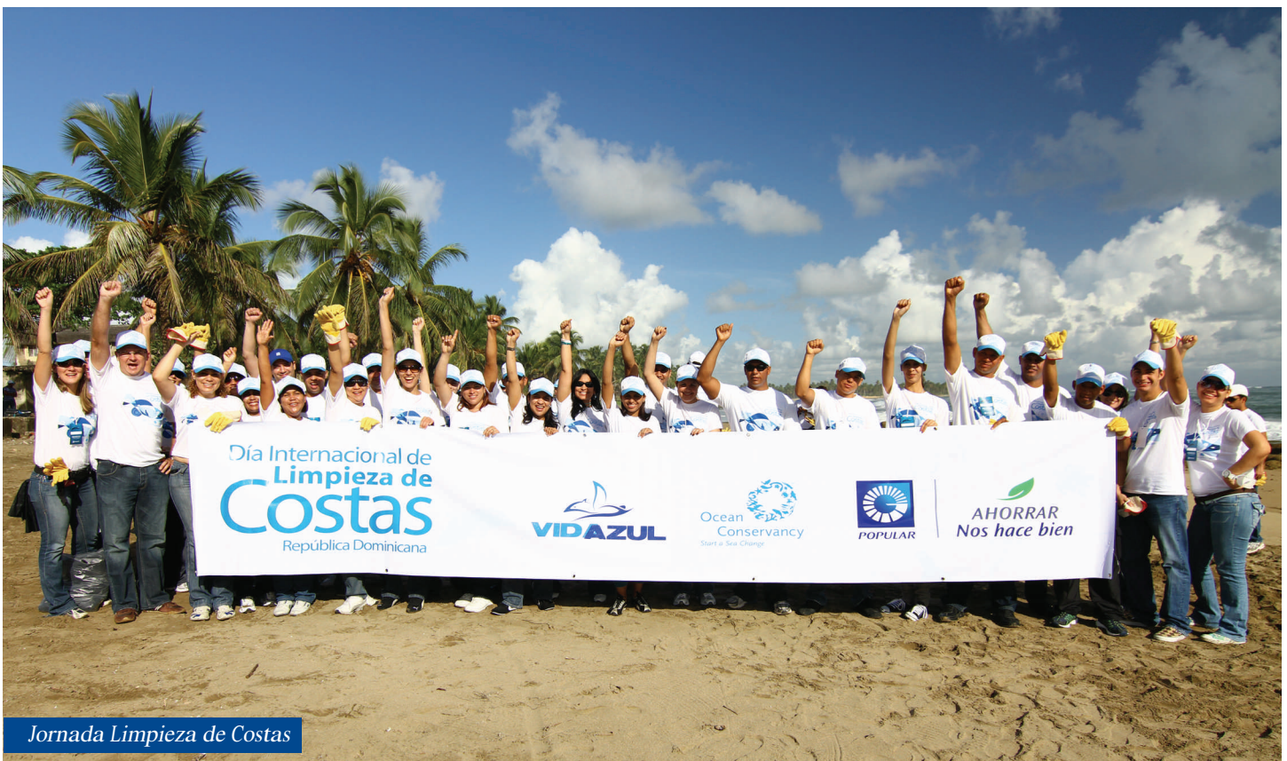
Jornada Limpieza de Costas

Como parte de nuestra iniciativa permanente “Ahorrar nos hace bien”, organizamos la celebración del concurso ¡Yo reciclo!, que coordinó el Centro para el Desarrollo Agropecuario y Forestal, Inc., CEDAF, una entidad privada sin fines de lucro, creada para promover el desarrollo sostenible en nuestro país. Esta iniciativa, dirigida a crear conciencia en la ciudadanía acerca de la importancia de cuidar el medioambiente y ser conservadores en el uso de la energía, el agua y los recursos naturales, logró la participación de más de 100 centros escolares en Santo Domingo.