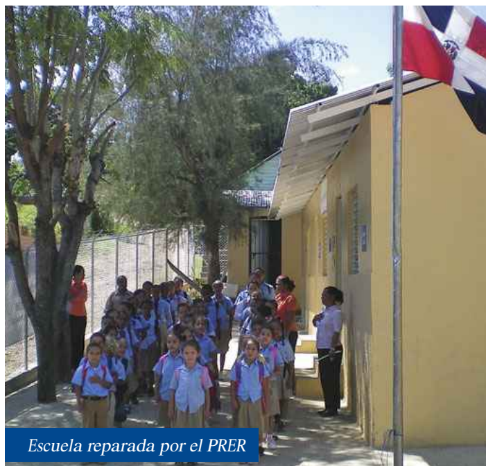
Escuela reparada por el PRER