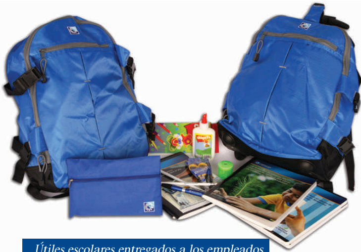
Útiles escolares entregados a los empleados

Desde 2009 fue reforzado el apoyo para la compra de útiles escolares, lo que repercutió en un aumento en el subsidio escolar. Además de este aumento también abrimos plaza para nuevas becas escolares para niños desde 1ero de básica hasta 4to de bachillerato.