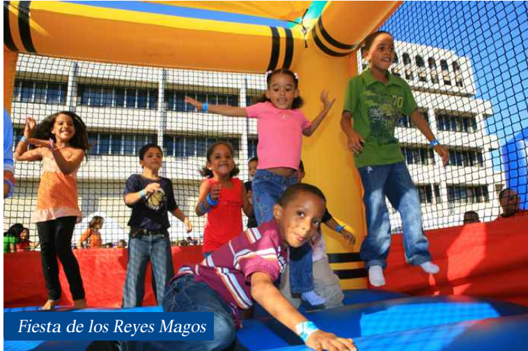
Fiesta de los Reyes Magos