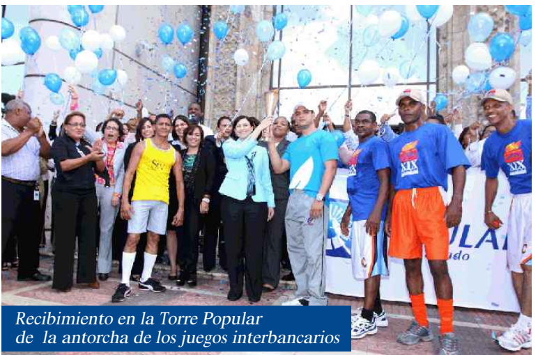
Recibimiento en la Torre Popular de la antorcha de los juegos interbancarios