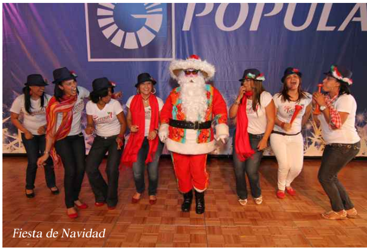
Fiesta de Navidad