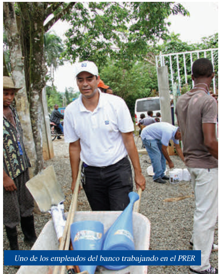
Uno de los empleados del banco trabajando en el PRER

En 2010 acudimos a las comunidades de Jánico, Santiago de los Caballeros y Dos Palmas en Cotuí para beneficiar a cientos de niños y más de 800 familias de escasos recursos económicos, ofreciendo a sus hijos la oportunidad de cursar estudios primarios en condiciones dignas. Ambas escuelas fueron dotadas de equipos para su sala de cómputos y se entregaron mochilas y otros útiles escolares a los estudiantes. De igual forma se remodelaron las oficinas administrativas y los baños, al igual que las cocinas y se contó con la instalación de verjas perimetrales para la seguridad de los estudiantes.