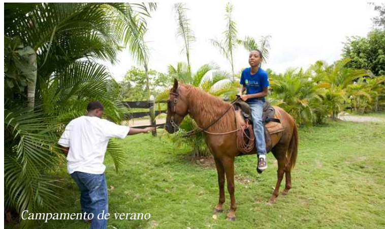
Campamento de verano